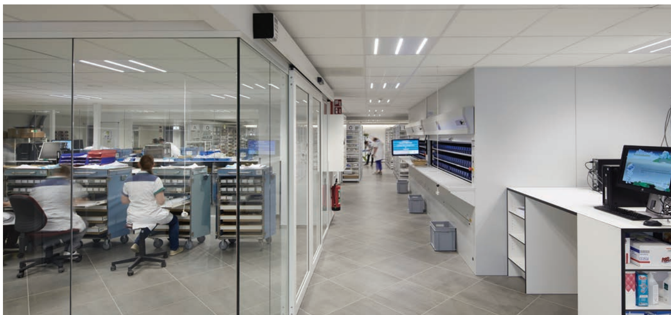
Distributieapotheek met administratieve zones