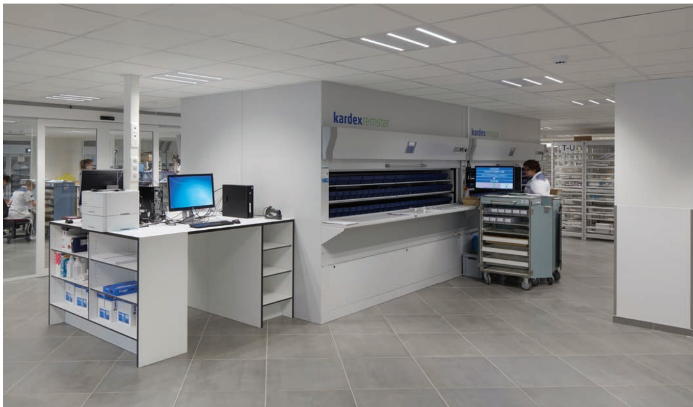
Medicatie opslag- en overslag d.m.v. Kardexkasten, medicatierobotten en rowakasten